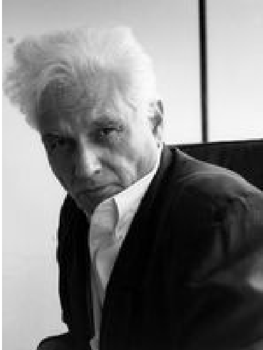
Jacques Derrida (1930-2004) (plus à venir – 3 dernières conférences)